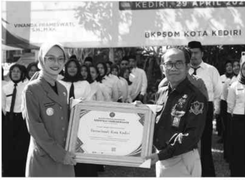
BKN memberikan penghargaan kepada Walikota Kediri Vinanda Prameswati atas percepatan pengangkatan tersebut.

SURABAYAPAGI, Kediri - Badan Kepegawaian dan Pengembangan Sumber Daya Manusia (BKPSDM) Kota Kediri menggelar upacara pengangkatan aparatur sipil negara (ASN) dan penyerahan SK Pegawai Pemerintah dengan Perjanjian Kerja (PPPK) dari Badan Kepegawaian Negara (BKN), Selasa (29/4/2025) di Halaman Balai Kota Kediri.