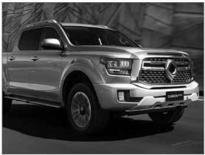
GWM Cannon Alpha.

Belum diketahui apakah edisi spesial Mazda MX-30 dijual dalam jumlah terbatas atau tidak. Soal harga, mobil ini dibanderol dengan harga mulai dari 2.935.900 Yen (Rp 304 jutaan) untuk versi Mild Hybrid, hingga 5.211.800 Yen (Rp 540 jutaan) untuk versi Full EV. ■jk-04/dsy