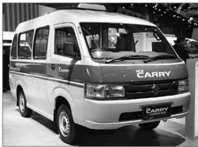
Suzuki Carry yang dikonversi BEV.

SURABAYAPAGI, Jakarta - Suzuki, otomotif terbesar asal Jepang baru saja mengumumkan akan segera memproduksi mobil pikap komersial yakni Carry ber-penggerak Battery Electric Vehicle (BEV). Di mana mereka akan meminjamkan pikap tersebut kepada sektor pertanian dalam jangka waktu tertentu, Selasa (29/04/2025). Lebih lanjut, nantinya Suzuki akan memulai eksperimen modelnya pada tahun fiskal 2025, dengan Percobaan demonstrasi dilakukan di sejumlah kota dari Homamatsu, Kosai, Toyokawa, dan Distrik Aso untuk disewakan selama satu tahun.