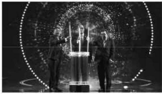
Pembukaan BSI GIFS 2025 di The Ritz – Carlton Pacific Place, Jakarta.

BSI GIFS 2025 mengusung tema besar "Transformative Islamic Finance as Catalyst for Growth". Sebelumnya, signature event dari BSI tersebut sukses digelar pada 2023 lalu.