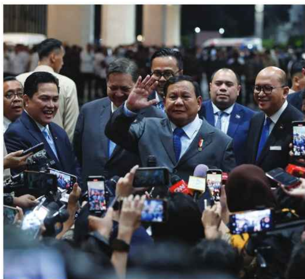
Prabowo Subianto ditemani CEO Danantara Rosan Roeslani dan Menteri BUMN yang juga Ketua Dewan Pengawas Danantara, Erick Thohir, menyapa wartawan di luar JCC usai acara.