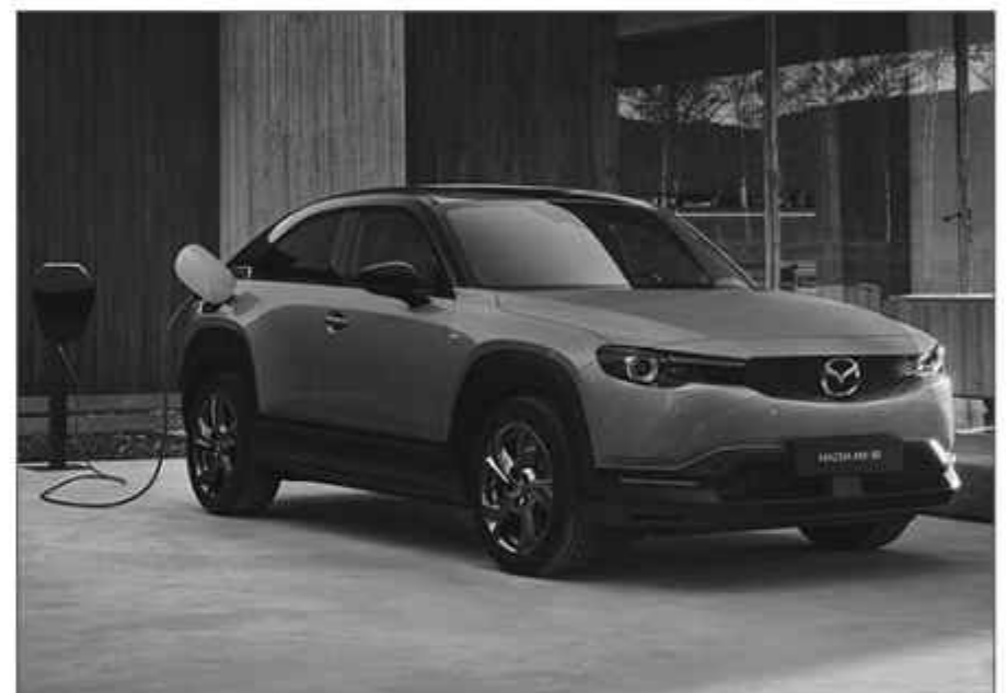
Mazda MX-30 Retro Sports Edition.

SURABAYAPAGI, Jakarta - Mazda secara resmi memperluas jajaran MX-30 dalam wujud 'Retro Sports Edition' untuk pasar dalam negeri, khususnya untuk pasar otomotif di Jepang, dengan sentuhan warna hitam yang menghiasi kaca spion dan pelek.