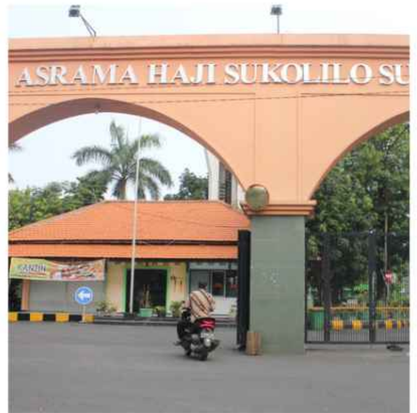
Seorang petugas masuk Asrama Haji Sukolilo Surabaya, Kamis, 24 April 2025.