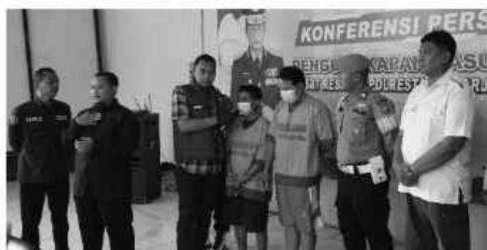
Kedua tersangka pencuri kabel tembaga menjawab pertanyaan petugas saat rilis.

Polisi menyatakan kedua tersangka akan dikenakan Pasal 363 ayat (1) ke-4 KUHP yang mengatur tentang tindak pidana pencurian yang dilakukan oleh dua orang atau lebih dengan bersekutu. Kedua pelaku dapat dijerat dengan ancaman hukuman tujuh tahun penjara. ■Sd-01/ham