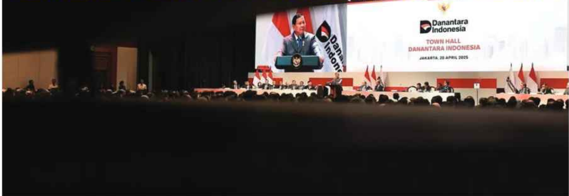
Foto kegiatan Town Hall Meeting Danantara bersama Direksi BUMN, di JCC Jakarta, Senin (28/4/2025), terpotret dari celah pintu dikarenakan acara meeting mendadak tertutup dari seluruh media yang hadir. Prabowo ber alasan, pertemuan tertutup karena menegur para direksi BUMN.

Saat Kekayaan Tembus US $ 1 triliun, Juga akan Bersih bersih Direksi BUMN