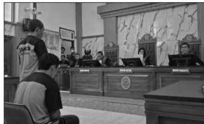
Terdakwa kasus kepemilikan ganja di lereng Gunung Semeru menjalani sidang vonis di Pengadilan Negeri Lumajang.

Hakim menyatakan bahwa terdakwa secara sah dan meyakinkan bersalah melakukan tindak pidana tanpa hak atau melawan hukum menanam, memelihara narkotika golongan I dalam bentuk tanaman berupa pohon