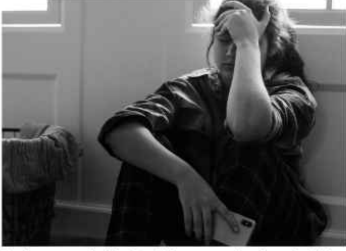
Anak yang menjadi korban kekerasan seksual membutuhkan intervensi secara berkala.