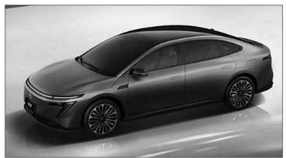
Dongfeng Nissan N7.

SURABAYAPAGI, Jakarta - Persaingan di pasar otomotif yang semakin waktu ke waktu semakin ketat, dengan banyaknya pemain lokal dan internasional yang berlomba-lomba menawarkan berbagai model dengan fitur dan harga yang menarik. Sebuah gebrakan signifikan baru saja dilakukan perusahaan patungan Nissan di China. Dongfeng Nissan, resmi meluncurkan sedan listrik terbarunya, N7, dengan harga yang sangat kompetitif. Peluncuran resmi N7 berlangsung meriah tadi malam. Langkah ini menandai salah satu kebangkitan terbesar dari produsen mobil patungan di China dalam beberapa tahun terakhir. Menariknya adalah banderol harga yang mulai dari 119.900 yuan atau setara Rp277 juta, harga ini jelas lebih murah dari sedan listrik terlaris dari Xpeng yakni Mona M03. Bahkan, harga N7 jauh lebih rendah dibandingkan sedan andalan BYD yakni Han L EV.