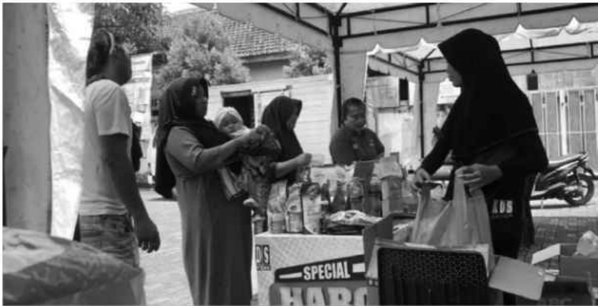
Operasi pasar bahan pokok yang digelar Pemerintah Kabupaten (Pemkab) Banyuwangi, Jawa Timur.

SURABAYAPAGI, Banyuwangi - Dalam rangka menjaga stabilitas harga bahan pokok (Bapak), Pemerintah Kabupaten (Pemkab) Banyuwangi mengencarkan operasi pasar yang terus dilakukan secara bergiliran di setiap kecamatan.