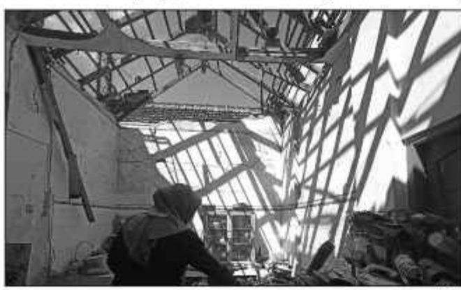
Kondisi rumah korban pasca kejadian.

Suwondo menyebut, korban sudah dibawa ke Rumah Sakit. Sementara rumah korban rusak parah, khususnya pada bagian atap dapur. ■Bl-01/ham