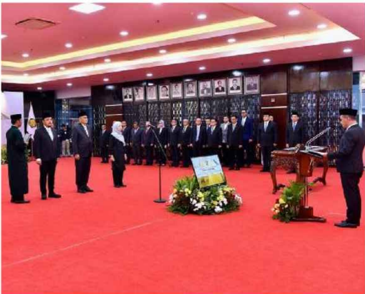
Menteri Energi dan Sumber Daya Mineral (ESDM) Bahlil Lahadalia saat melantik tiga Pejabat Tinggi Pratama di Kementerian ESDM, Senin, 28 April 2025.

Komisi Eropa dan otoritas terkait, tengah menyelidiki insiden langka ini yang mengingatkan pada pemadaman listrik di Italia pada 2003. ■ enn, ec, rmc