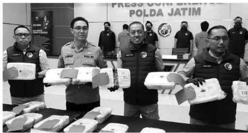
Polisi menunjukkan barang bukti sabu saat rilis.

ditangkap di depan Pelabuhan Semayang, Balikpapan," ujar Kombes Pol Jules Abraham Abast dalam konferensi pers di Mapolda Jatim, Selasa (29/4/2025).