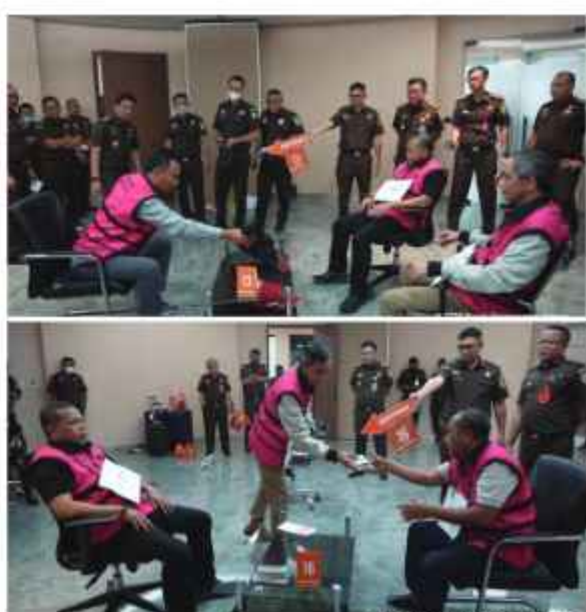
Proses raga ulang saat para hakim dibagi-bagi uang Rp 60 miliar dari suap vonis lepas kasus minyak goreng.