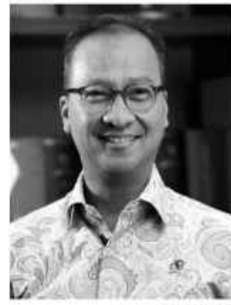
Menperin (Menperin) Agus Gumiwang Kartasasmita.

Agus juga menyampaikan Pemerintah Indonesia memastikan bahwa investasi yang dibawa ke tanah air akan berjalan dengan lancar. Selain itu, Pemerintah