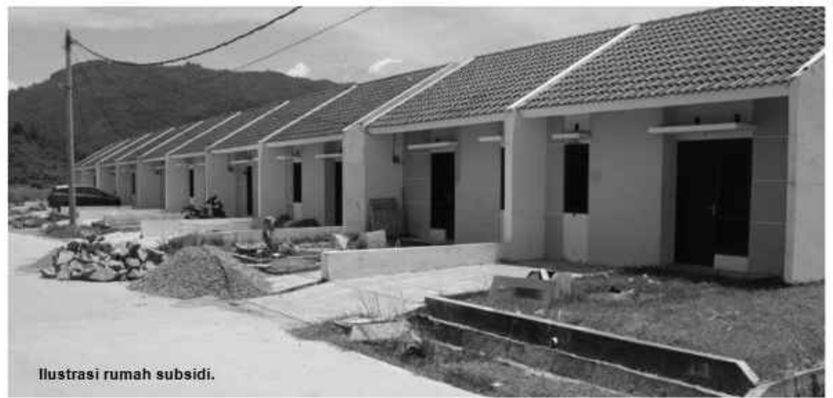
Ilustrasi rumah subsidi.

Wakil Ketua Umum DPP Real Estate Indonesia (REI), Bambang Ekajaya, menyambut positif perubahan ini. Menurutnya, kebijakan baru ini akan menjadi angin segar tidak hanya bagi konsumen, tetapi juga bagi pengembang properti.