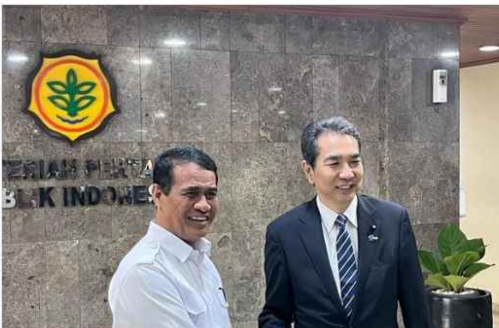
Menteri Pertanian Andi Amran Sulaiman

Saat ditanya apakah ada rencana Indonesia ekspor beras ke Jepang, Amran menga-