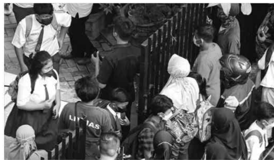
Ilustrasi. Sekolah Dasar (SD) saat mendaftar ke sekolah.

Lebih lanjut, adanya SPMB dengan penerapan jalur yang baru ini memang sengaja dirancang untuk menghadirkan pemerataan akses pendidikan yang lebih adil dan bebas