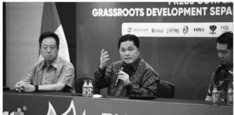
Ketua Umum PSSI, Erick Thohir, dalam Press Conference dalam pengembangan sepak bola Putri, Selasa (29/4/2025) di Jakarta.

"Tetapi kalau PT LIB dan klub ingin melakukannya, pastikan bertanggung jawab. Kalau nanti ada peristiwa seperti Tragedi Kanjuruhan lagi, jangan sampai nanti bolanya dilempar ke sana dan ke sini seakan tidak punya rasa tanggung jawab," tegas Erick Thohir. ■ids/bsp/it/arm