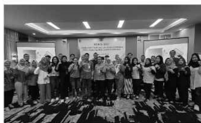
BPJamsostek Mojokerto saat melakukan sosialisasi Program Sertakan dan Permenaker Nomor 1 Tahun 2025, serta penggunaan aplikasi JMO (Jamsostek Mobile).

"Dalam kesempatan ini kita juga menjelaskan perubahan substansi dalam Peraturan