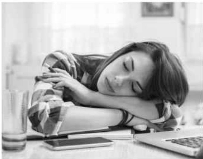
Tidur siang dengan durasi lama dapat dikaitkan dengan berbagai dampak negatif pada kesehatan.

"Anak tidak hanya membutuhkan kualitas tapi juga kuantitas, jadi luangkan waktu sebanyak mungkin dengan anak," kata Feka yang tergabung dalam Ikatan Psikolog Klinis Indonesia wilayah DKI Jakarta itu. ■hlt/arm