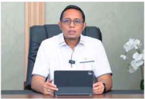
Hasan Nasbi mundur menjadi Juru Bicara Presiden.

SURABAYA PAGI, Jakarta - Hasan Nasbi, mengundurkan diri dari jabatan Kepala Kantor Komunikasi Presiden atau PCO. Hasan telah mengirimkan surat pengunduran diri kepada Presiden Prabowo Subianto melalui Seskab dan Mensesneg.