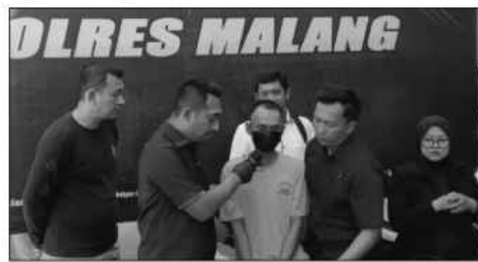
Tersangka menjawab pertanyaan petugas saat rilis kasus.

Saat membuntuti itulah, pelaku mengetahui jika korban saat mengantar Yakult ke pelanggannya dan meninggalkan kendaraan miliknya dalam