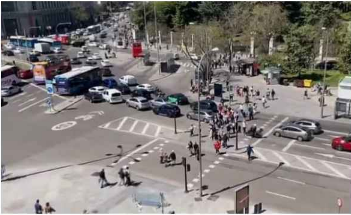
Spanyol dan Portugal Lumpuh akibat Pemadaman Listrik Misterius.